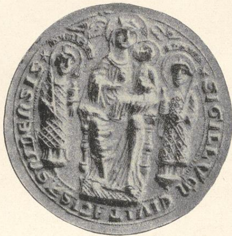
Altes Essener Stadtsiegel aus dem 13. Jahrhundert

BEARBEITET UND HERAUSGEGEBEN IM AUFTRAGE DES OBERBÜRGERMEISTERS VOM BEIGEORDNETEN DIPL.-ING. HERMANN EHLGÖTZ, ESSEN