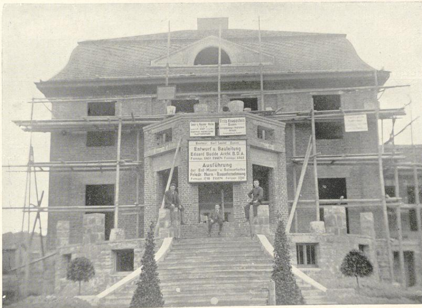
Neubau Seidel. Ausführung 1924