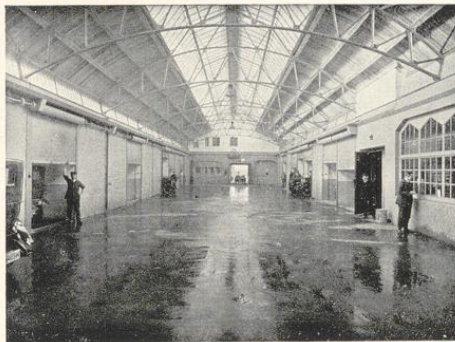
Blick in die Halle im Erdgeschöß.

Eine Besichtigung der Anlagen ist jedem Interessenten unter Führung gern gestattet.