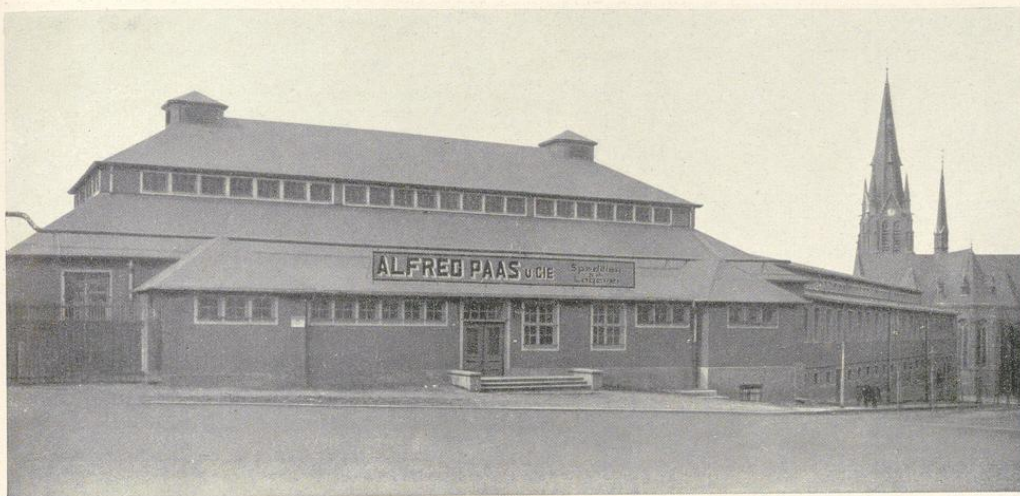
Alfred Paas u. Cie., Lager Harkortstraße

In engster Verbindung mit der Firma Heinrich Paas steht die Tochterunternehmung Heinrich Paas G. m. b. H. in Hamburg, die, wie eine weitere Tochterfirma in Rotterdam, zur Pflege der überseeischen Beziehungen gegründet ist.