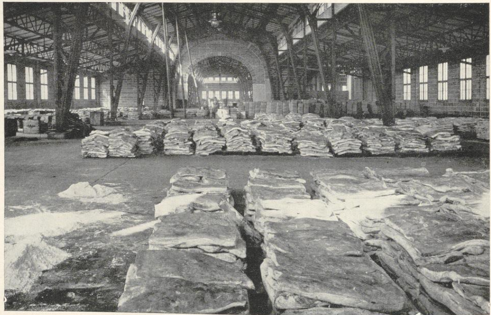
Alfred Paas u. Cie., Teil des Hauptlagers