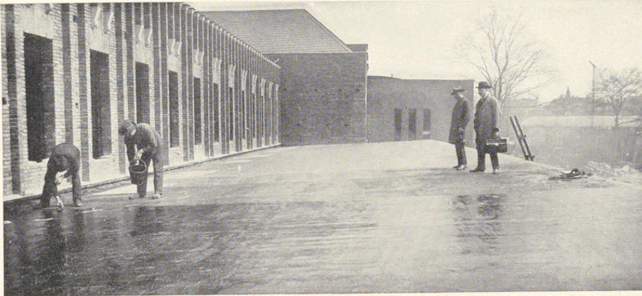
Durumfix auf Stegzementdielen