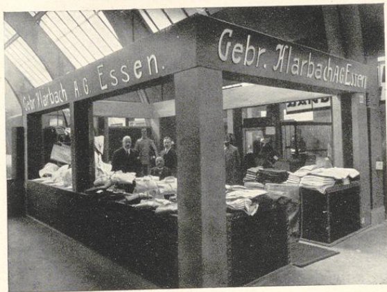
Kölner Messestand (März 1925)

Die Firma Gebr. Klarbach wurde im Jahre 1866 gegründet. Sie war die erste Firma in Essen, die sich mit der Herstellung von Arbeiterkleidung auf maschinellem Wege befaßte. Mit dem Wachsen der Industrie im Ruhrkohlenbezirk gewann auch der Betrieb der Firma Gebr. Klarbach ganz bedeutend an Ausdehnung. Im Jahre 1900 verlegte sie ihren Betrieb in das neuerbaute Fabrikgebäude Theaterplatz 9 gegenüber dem Stadttheater. Hier wurde die Firma durch Aufstellen moderner und praktischer Maschinen in die Lage versetzt, ihren Betrieb nach jeder Richtung hin zu verbessern und zu vergrößern, so daß sie heute zu einer der ersten Firmen am Platze gehört.