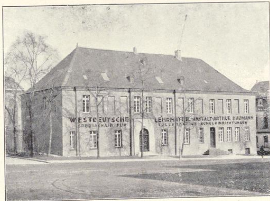
Geschäftshaus und Ausstellungsräume, Essen, am Burgplatz 5

Sonderabteilungen für „Werkunterricht“ sowie für „Projektions- und Kino-Apparate.“ Die spezialfachmännische Leitung der einzelnen Abteilungen gewährleistet den Kunden eine individuelle, sorgfältige Bedienung und Beratung.