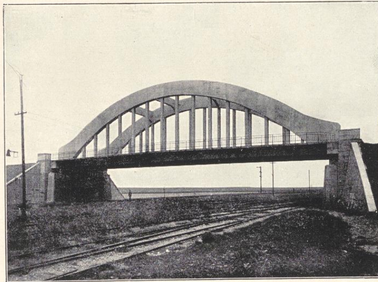
Straßenbrücke bei Rommerskirchen

In Oberhausen, Bruckhausen, Differdingen, Tilsit