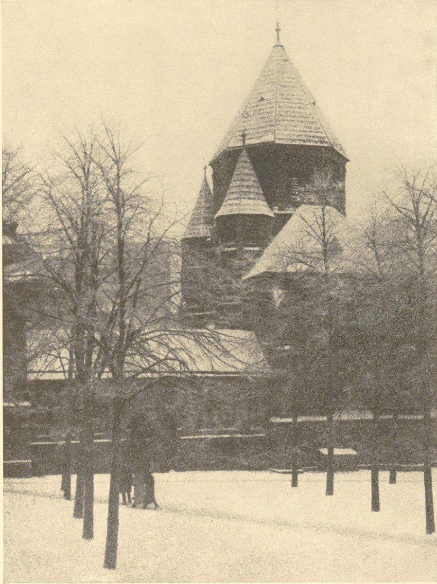
Westbau des Münsters