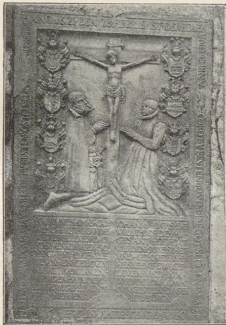
Fig. 4. Kirche in Bissendorf; Grabmal.

Auf dem in die äussere Südwand eingelassenen, aus Sandstein gearbeiteten Grabmäler. Grabmale (Fig. 4) ist in der Mitte der Gekreuzigte, und es sind darunter eine knieende männliche und eine knieende weibliche Figur, sowie auf jeder Seite vier Wappen zu sehen. Die Umschrift in Lapidaren lautet: