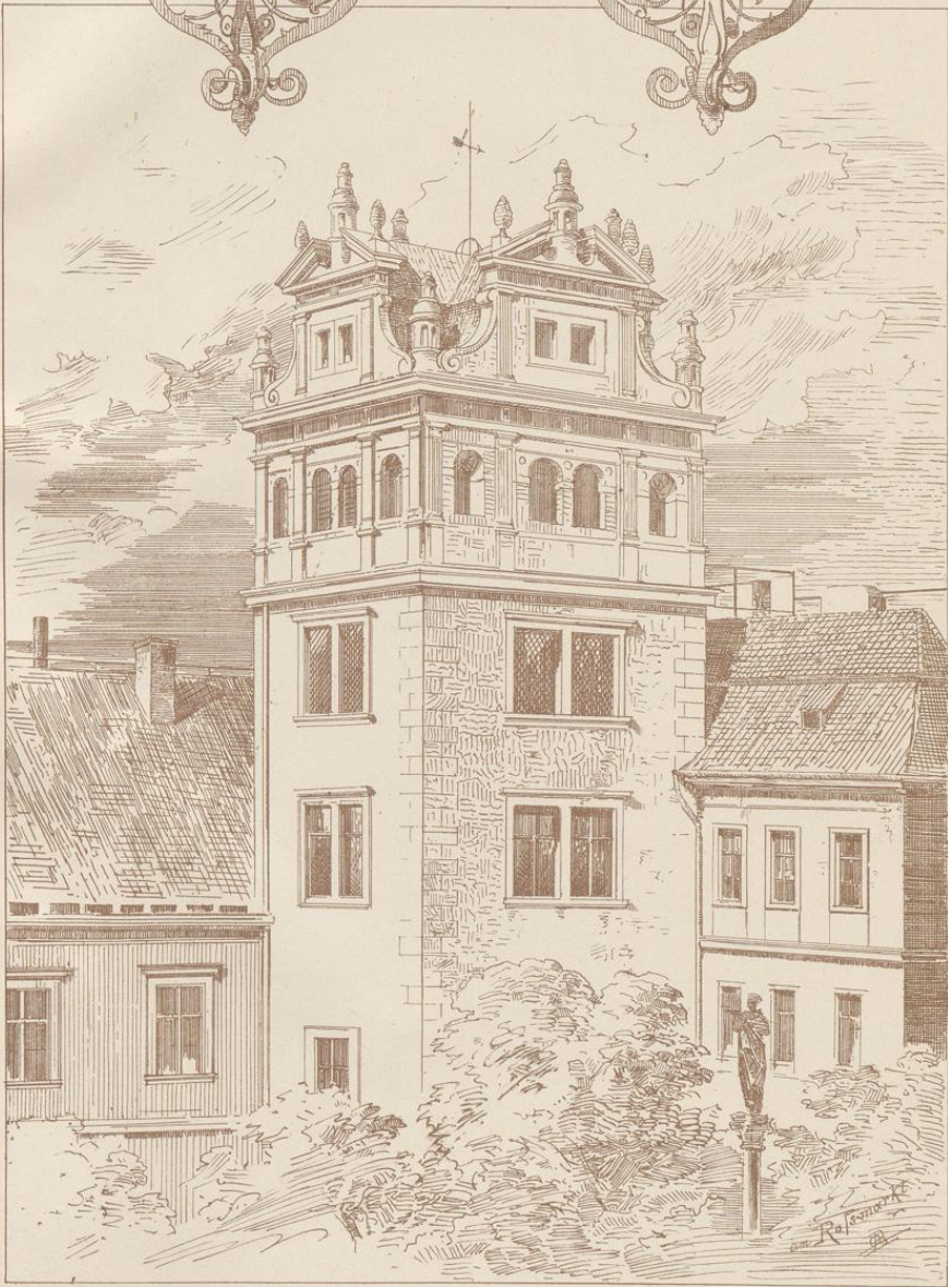
Aut. Druck v. J. G. Fritzsche, Leipzig.