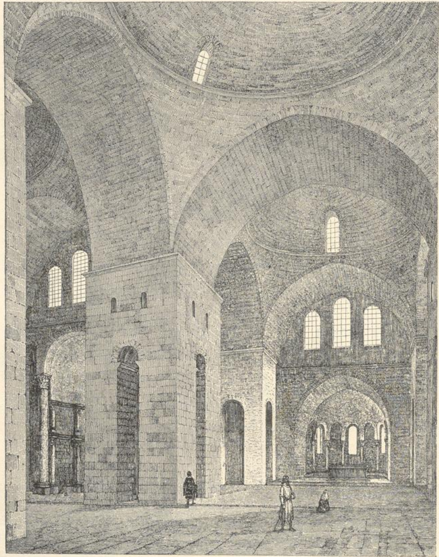
77. Inneres von St. Front zu Périgueux (nach Gailhabaud).

Basiliken mit Kuppeln sind: Notre-Dame du Puy bei der Stadt Puy, vielleicht aus der Frühzeit des 11. Jahrh. und St. Hilaire zu Poitiers. Die erstere ist dreischiffig mit weit vorspringenden Kreuzarmen mit Laternen und runder Kuppel über der Vierung und Tonnengewölben in den Kreuzarmen, im ganzen