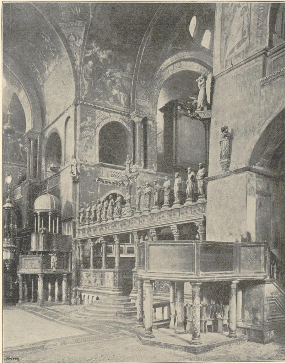
75. Inneres von S. Marco in Venedig. Teil des Querschiffs.

auf den Längsbau angewendet. Dasselbe ist im südlichen Frankreich, in Aquitanien, speziell in den Landschaften Périgord, Angoumois und Saintonge, außer-