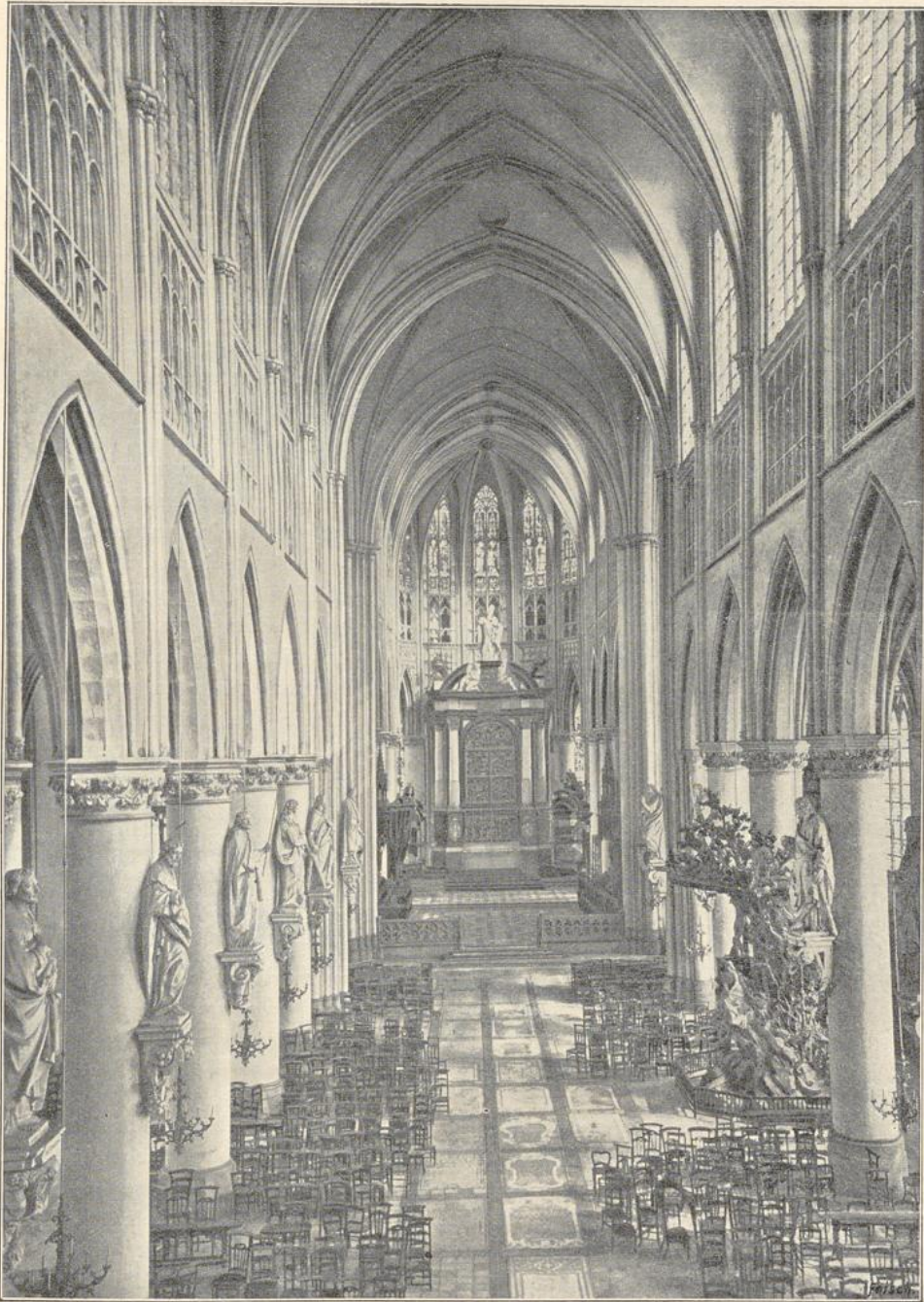
96. Inneres der Kathedrale zu Mecheln. (Nach einer Photographie).

geordnet. Die räumliche Gesamtwirkung ist großartig, wenn auch nicht ganz harmonisch. — Notre-Dame des Victoires ebendort, aus der zweiten Hälfte des