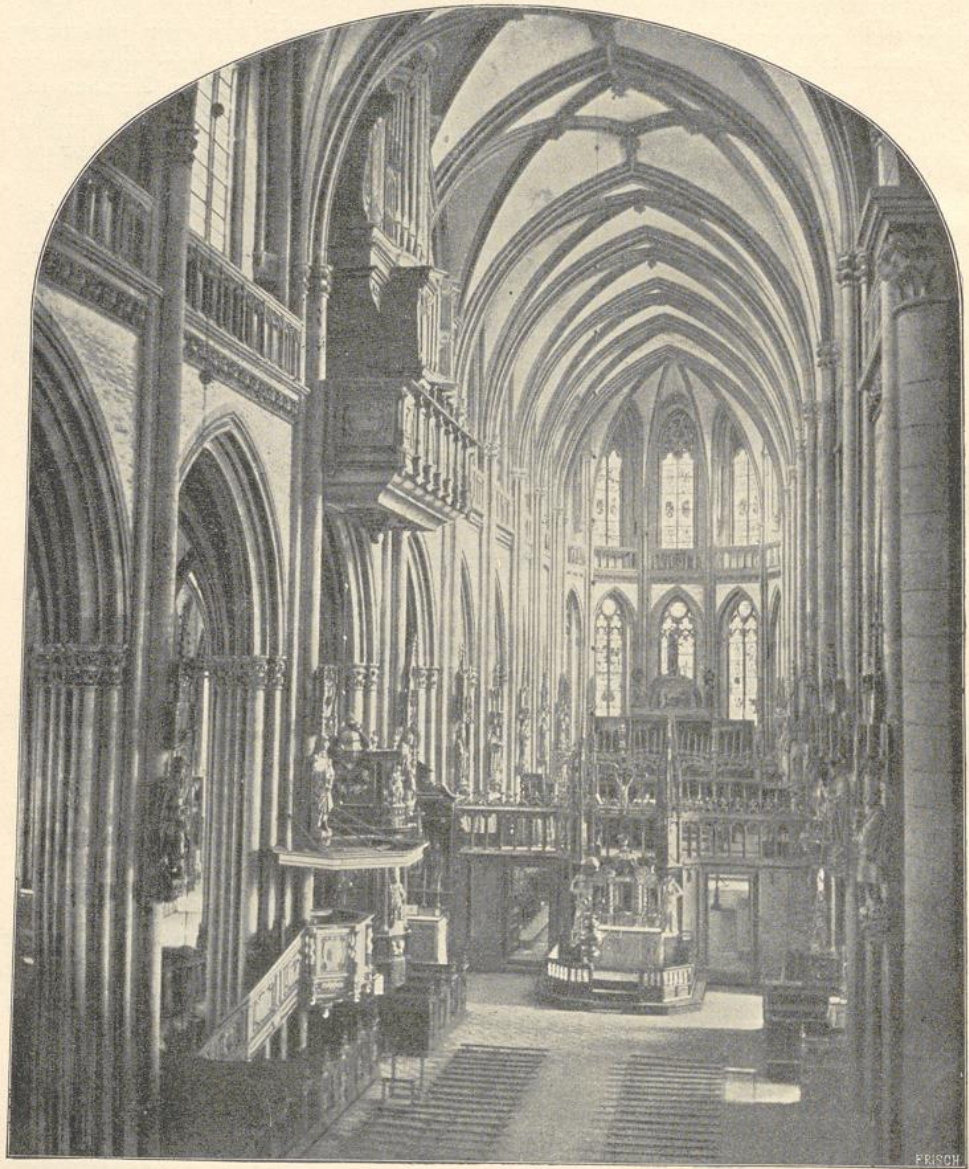
III. Inneres des St. Victoriums in Xanten.

dals in Xanten der Hauptchor verkürzt ist und die übereck gestellten Nebenchöre polygonal gestaltet sind, hat im Inneren einen Laufgang statt des Triforiums (Abbildg. 110). Die letzten Joche des Ostteils mit den Seitenschiffen, seit 1396 im Bau, gehören der Kölhnischen Schule an, ebenso der größte Teil des spät-