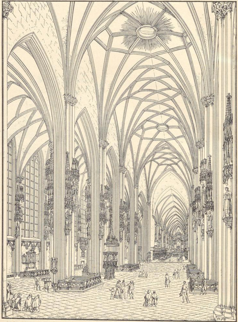
116. Inneres des Doms St. Stephan zu Wien. (Nach Chiese principali d'Europa).

mehrter Mittelschiffsbreite; die Seitenwände zeigen in jedem Joch zwei Fenster, die Pfeiler sind reich gegliedert (Abbildg. 115). Die innere Gesamtwirkung des