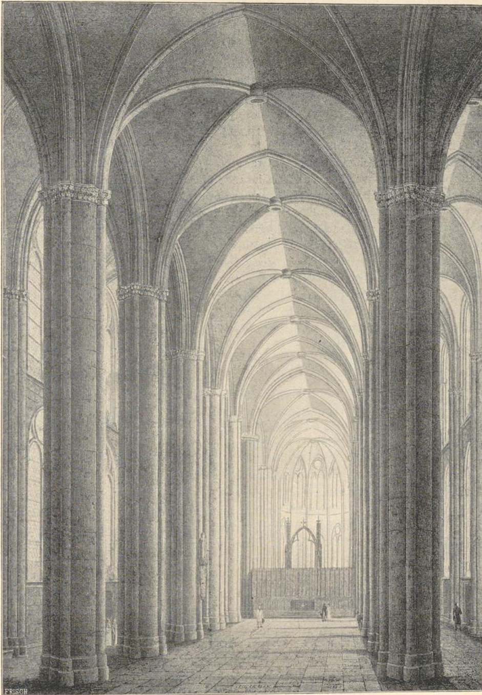
114. Inneres der Elisabethkirche in Marburg. (Nach Moller).

St. Blasiiikirche in Mühlhausen, vom Ende des 13. bis zur Mitte des 14. Jahrh. gebaut, ist mit einem einschiffigen, polygonal geschlossenen Chor versehen.