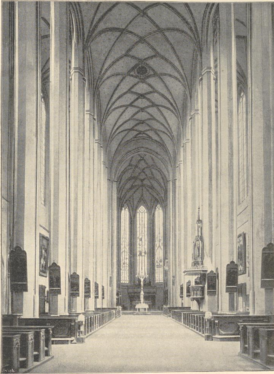
119. Inneres der Martinskirche in Landshut.

hat achteckige Pfeiler, im Chor Netzgewölbe, im Langhause und Umgänge flache Decken. — Die St. Martinskirche in Landshut, nach 1407 begonnen, bildet einen