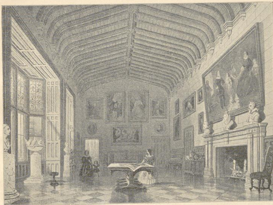
130. Charlecote Great Hall. (Nach S. C. Hall).

Deutschland. Als ein vorzügliches Muster des von einer Idee beherrschten, nach einem einheitlichen Plane gestalteten Schloßbaues, in dieser Hinsicht seiner Zeit voraneilend, erscheint die Albrechtsburg in Meissen, 1471—83 von Meister Arnold von Westfalen ausgeführt. Die unregelmäßige Gestalt der Gesamtanlage