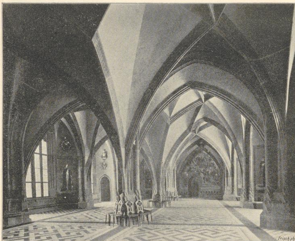
131. Kirchsaal in der Albrechtsburg zu Meissen. (Nach einer Photographie von E. Schröter).

sieben Haupträume des Geschosses unmittelbar zugänglich gemacht worden sind, teilweise mit Zuhilfenahme innerer Gänge. Die Einzelgestaltung der Räume des Schlosses ist an malerischem Reiz unübertroffen. Im ersten Obergeschoß liegt der Kirchsaal, dessen Gewölbe auf drei Mittelsäulen ruhen, und dessen Grundfläche durch fünf Fensternischen von ca. 5 m Länge und 2 m Tiefe erweitert ist (Abbildg. 131); außerdem schließt sich an denselben die kleine Kapelle an, welche mit zwei Seiten des Sechsecks beendet ist und außen einen schmalen Umgang hat. Die an den Kirchsaal anstoßende Hofstube, der größte Raum des Schlosses, ist wieder mit großen Fensternischen ausgestattet. Im Norden, an dieselbe anschließend, folgt der kleinere quadratische Bankettsaal. Die Räume