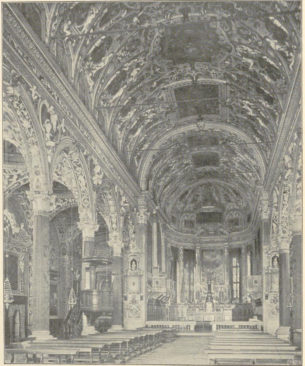
6. Inneres von Sta. Maria delle Grazie in Brescia. (Nach Photographie von O. Schmidt).

zeigen sich architravierte Rundbögen. Ein Umgang, der als Galerie in der halben Höhe des Mittelschiffs die Pfeiler verbindet und sich an der Rückseite derselben fortsetzt, durchzieht das ganze Innere der Kirche. Die gotischen