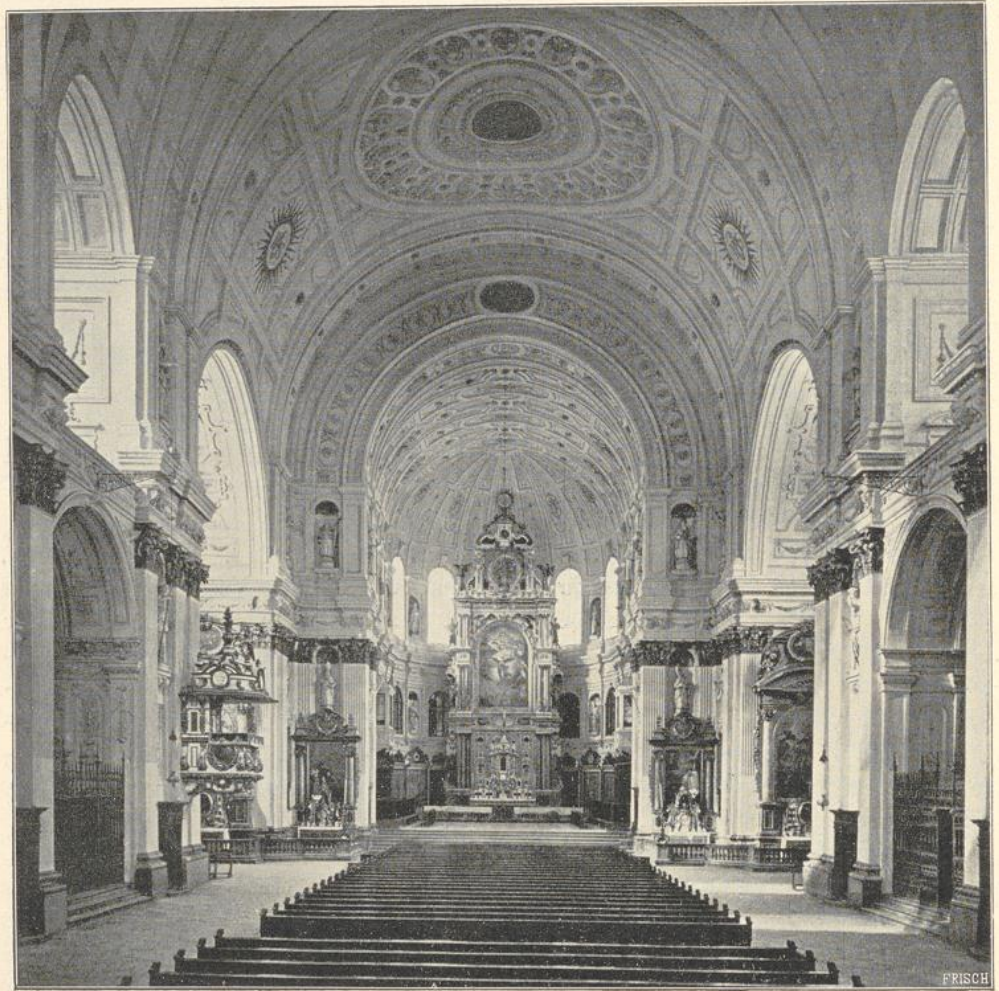
8. Inneres der St. Michael-Hofkirche in München.

Eine besondere Gruppe der deutschen Renaissancekirchen bilden eine Anzahl Jesuitenkirchen, welche nach dem Vorbilde des Gesù in Rom errichtet sind, mindestens was die Grundriffsform anbelangt. Es befinden sich unter diesen Kirchen einzelne hervorragende Anlagen.