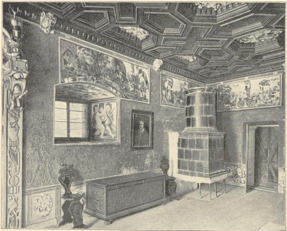
28. Kapellenzimmer in Churburg.

Die in der Renaissancezeit errichteten Landschlösser unterscheiden sich in