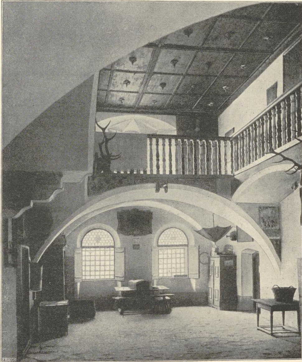
52. Diele im Winkelhof bei Brixen.

Villa Altieri in Rom, Strada Felice, von Gio. Ant. de' Rossi, zieht sich durch die ganze Breite des Casinos eine mit Kreuzgewölben überdeckte Galerie hin, von welcher 2 Treppen zugänglich werden; nach der Terrasse hin liegt eine Flucht von Wohnräumen. Villa Albani, außerhalb Roms, 1746 von Carlo