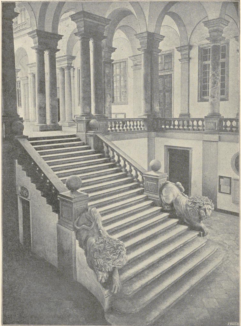
53. Vestibül in der Università zu Genua.

von 1692, zeigt wenigstens den Geist Guarinis in einem mächtigen rechteckigen Vorhause, welches durch toskanische Säulen gegliedert ist.