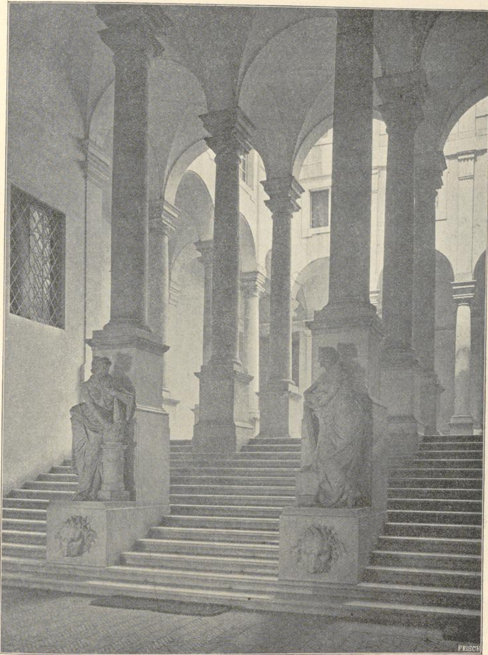
54. Vestibül im Palazzo Durazzo zu Genua.

einem Umbau vom Ende des 18. Jahrh. her, welcher durch Andrea Tagliafico bewirkt wurde. Das Vestibül ist durch Säulenstellungen geteilt und mit Kreuzgewölben überdeckt; aus demselben führt eine dreiteilige Treppe in den höher