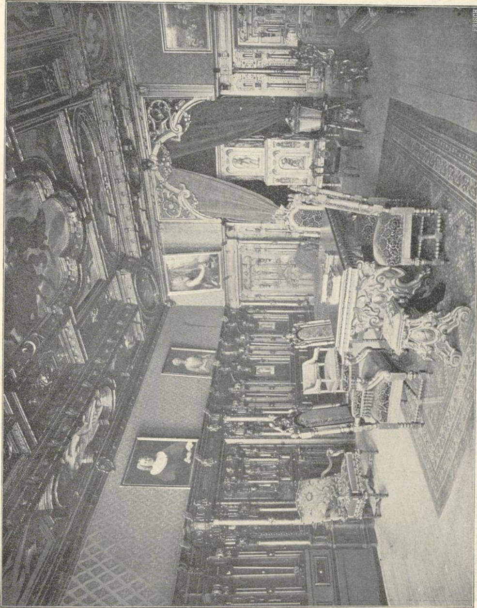
89. Zimmer im Pellerhause zu Nürnberg. (Nach Photographie von S. Soldan).

Im Kreise Tondern (Schleswig-Holstein) sind 2 Hauberge bemerkenswert. Von diesen enthält der Bombüllhof bei Klauxbüll noch Theile von 1550, aber