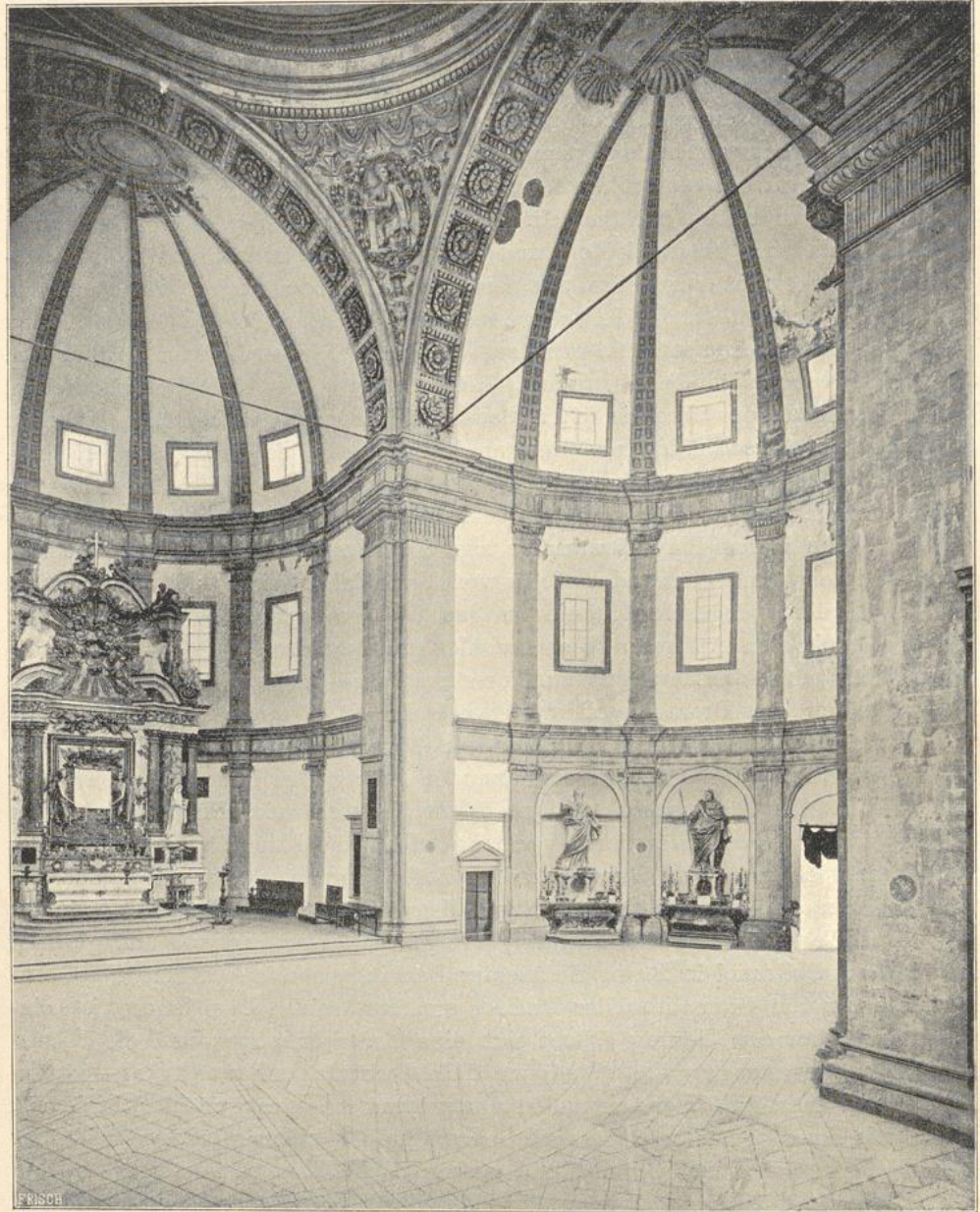
4. Inneres von Sta. Maria della Consolazione in Todi.

Halbprotunden, welche die Arme eines griechischen Kreuzes bilden, erhebt sich über einem ebenfalls mit Pilastern versehenen Tambour eine Rundkuppel mit Laterne. Das Innere ist von großartiger Wirkung, sowohl durch die Höhe als