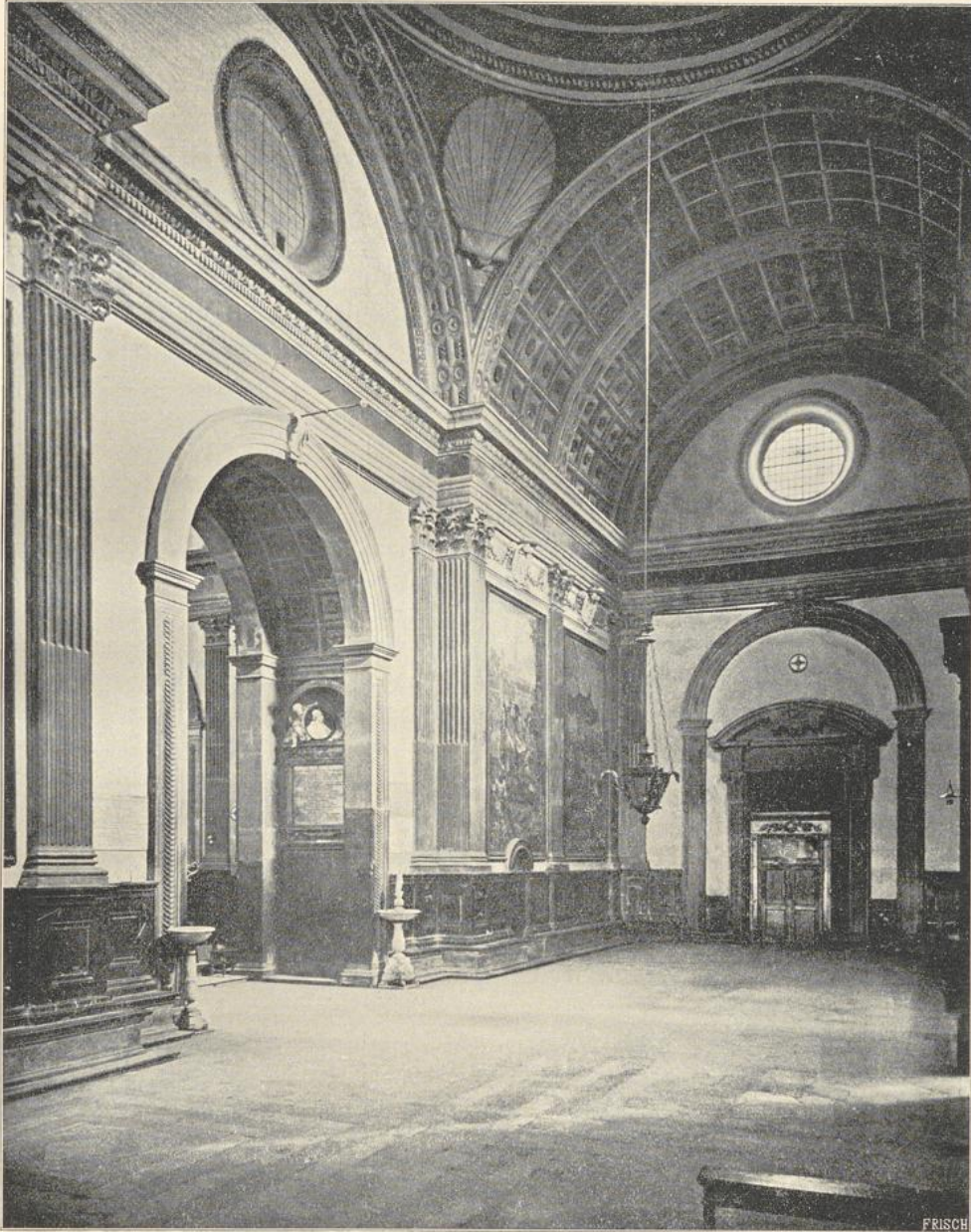
2. Inneres der Madonna dell' Umiltà in Pistoja.

späteren Zeit des Sanmichele, hat 4 Wandnischen und eine Vorhalle, und zeigt eine geistvolle und prächtige Durchführung der antiken Formen bis in die Kassetten der sphärischen Kuppel. Madonna di Campagna bei Verona, 1559 nach