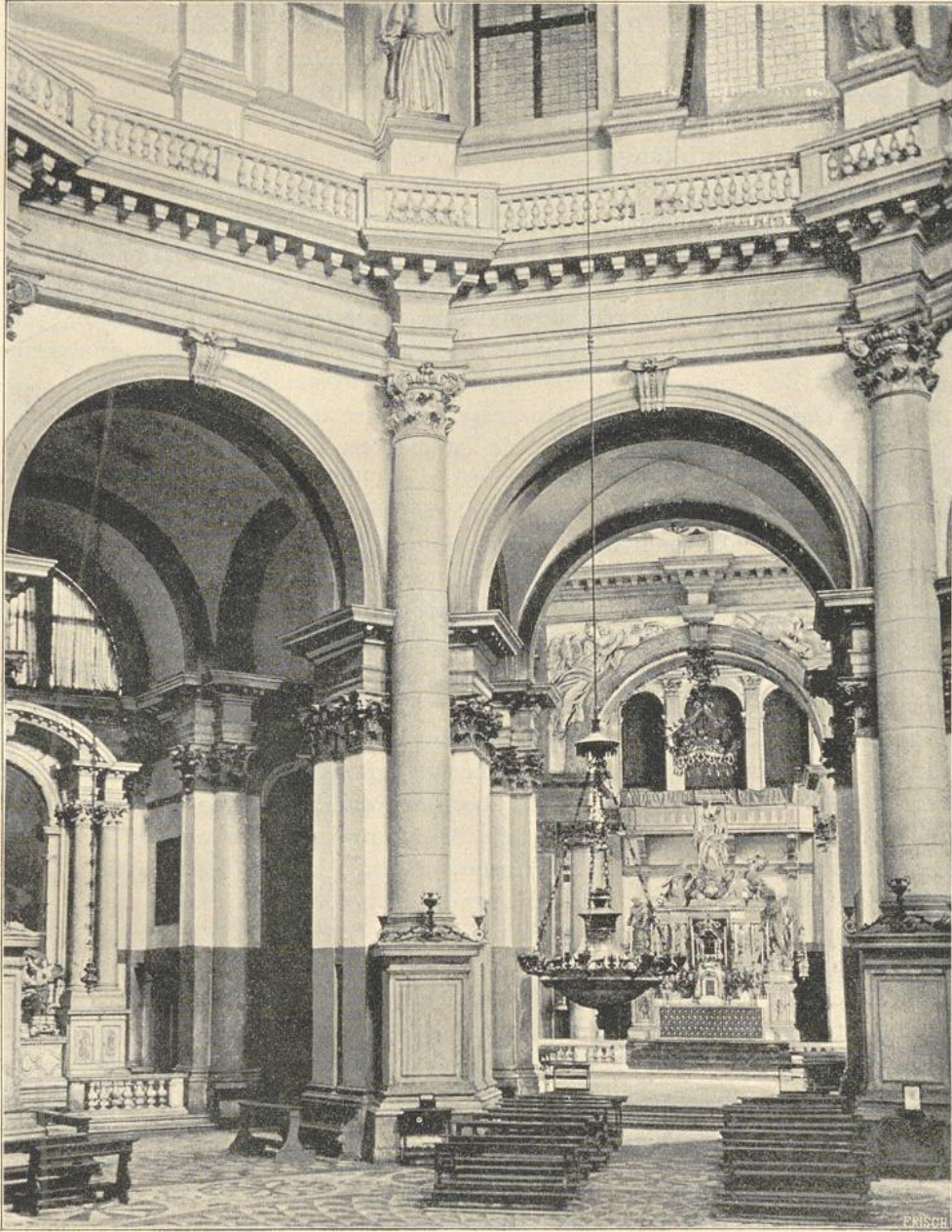
3. Inneres der Kirche della Salute in Venedig.

Das Innere der Kirche erscheint in eine mystische Dämmerung gehüllt. Die Kapelle S. Sudario an S. Giovanni in Turin, wieder ein Kreisbau, von 1673—94, ist in 8 Seiten geteilt, welche durch korinthische Pilaster getrennt sind; breite