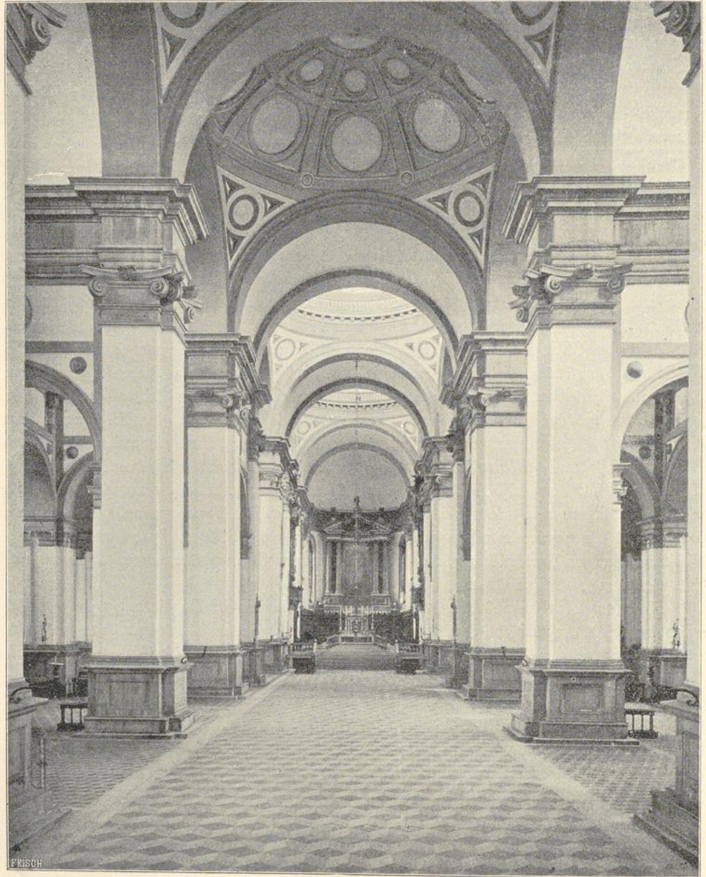
13. Inneres von Sta. Giustina zu Padua.

Chorbildung. Die 3 Kuppeln hintereinander ruhen auf je 4 breiten Bögen, die Eckräume erscheinen als freie Durchgänge auf schlanken Pfeilern; die Kuppeln erhalten selbständiges Licht durch die Laternen. (Abbildg. 14). Der Dom zu