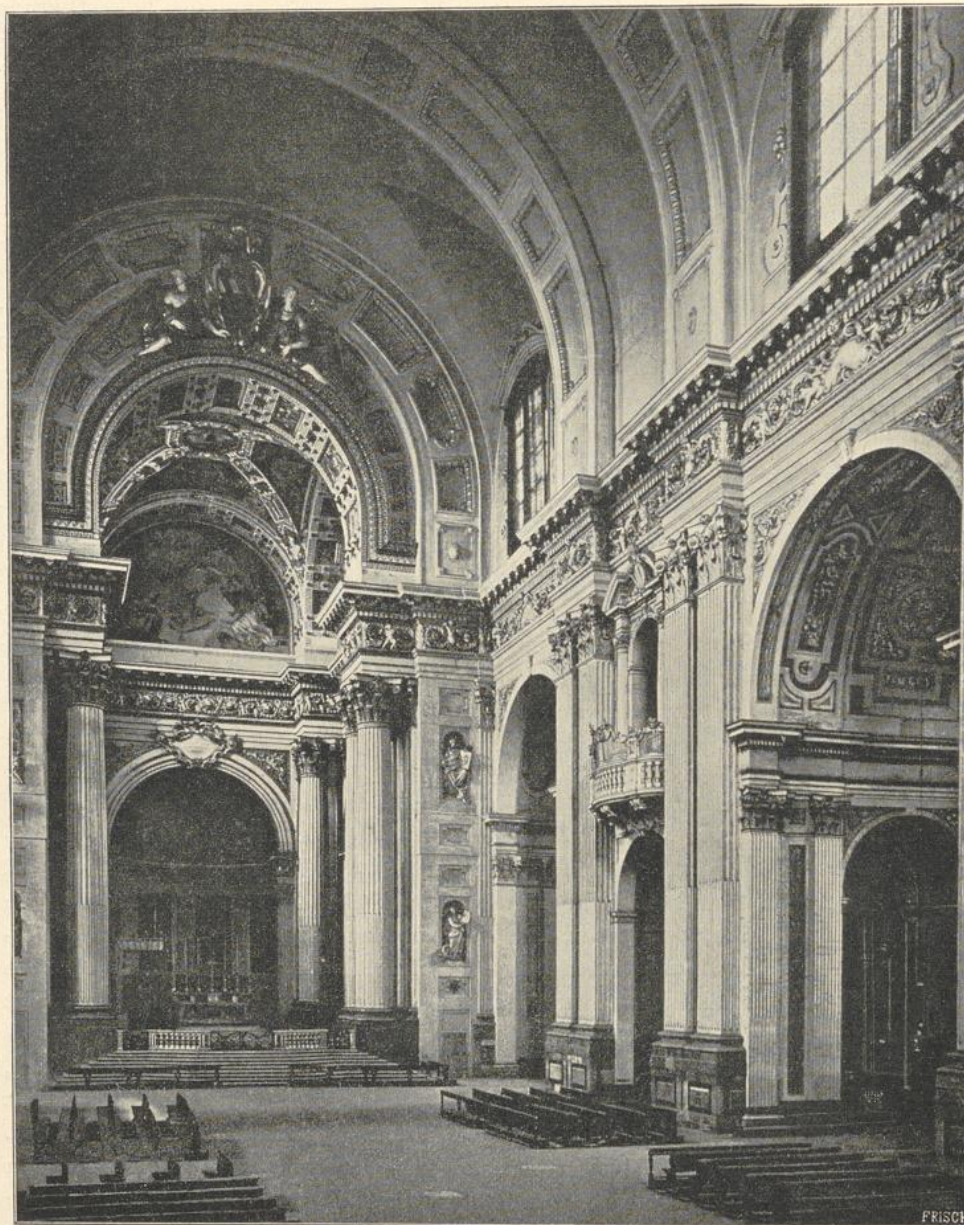
12. Inneres des Doms S. Pietro in Bologna.

und niedrigere Bögen zwischen diesen angeordnet. Die Langhausanlage nähert sich demnach dem griechischen Kreuz. Der quadratische Chorraum ist mit flacher Kuppel bedeckt und öffnet sich nach 3 Seiten, nach der Apsis und nach den