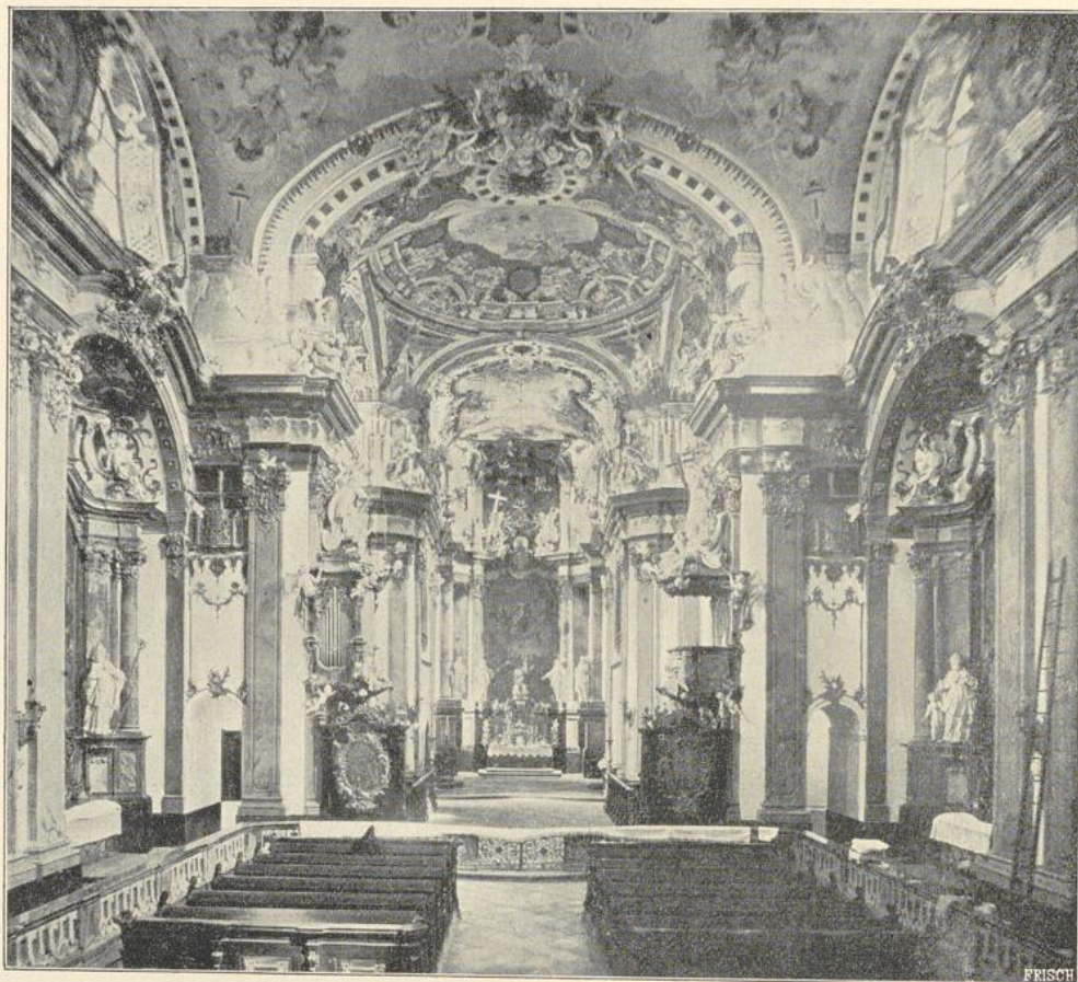
23. Inneres der Stiftskirche zu Wilhering.

Kapellen mit Emporen anschließen. Ähnlich der vorigen ist die von Donato Felice d'Allio 1717—30 erbaute Salesianerinnenkirche am Rennwege in Wien; es ist hier ebenfalls eine Kuppel vorhanden. Die Kirche des Klosters Melk (Erzherzgt. Österreich), zwischen 1702 und 1736 von Jac. Prandauer erbaut, hat eine Kuppel mit Laterne. Der Grundriß der Kirche entwickelt sich aus dem Gesù; die Emporen über den Seitenschiffen sind mit originellen Holzeinbauten ausgestattet. Der Umbau der Kirche auf dem Weitzberge bei Weitz (Steiermark) findet 1766—73 statt. Die Stiftskirche zu Pöllau (Steiermark), 1701—1709 von