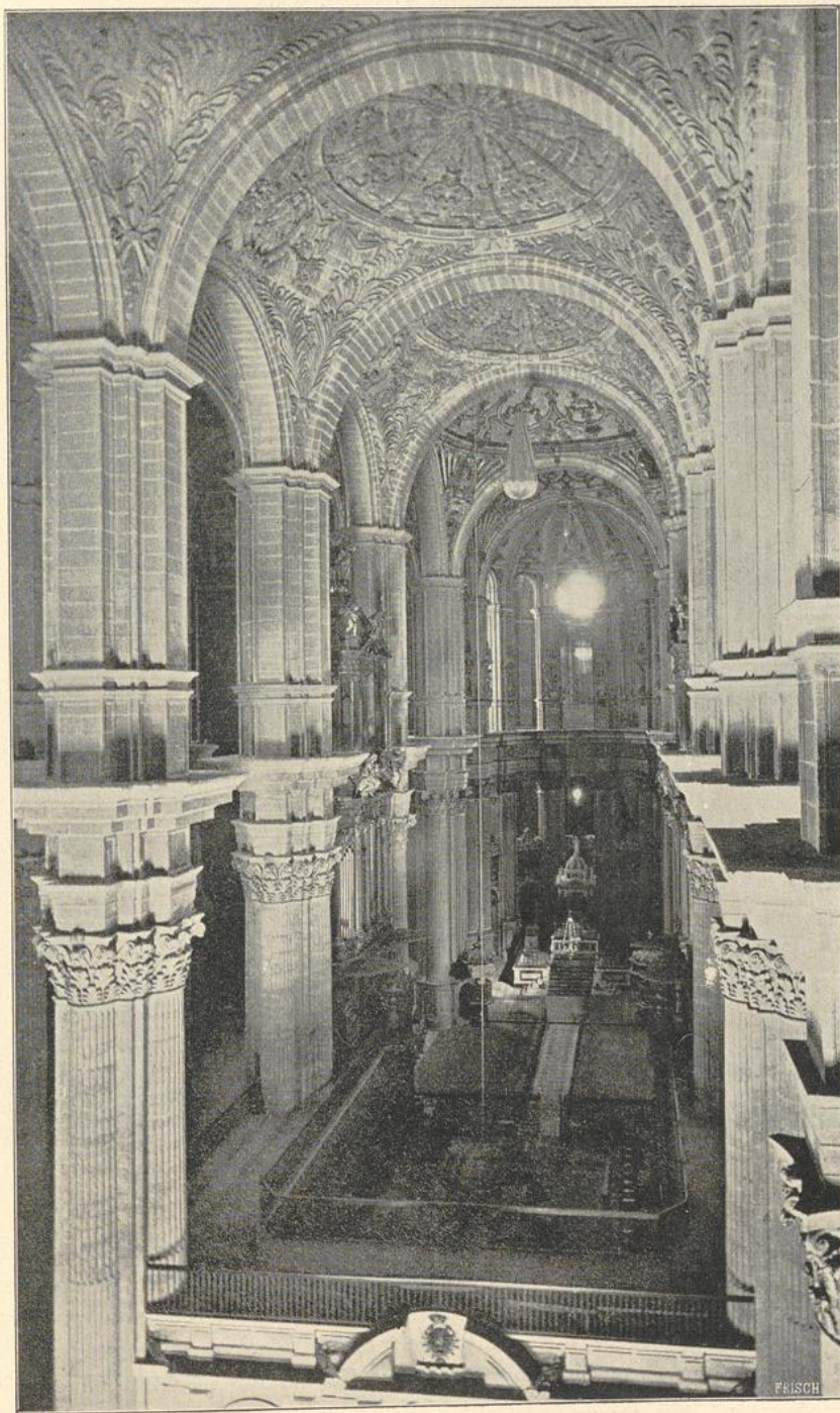
16. Inneres der Kathedrale zu Malaga. (Nach Photographie von J. Laurent & Co.).

An der Abtei Weingarten bei Ravensburg (Württemberg) wurde 1715—24