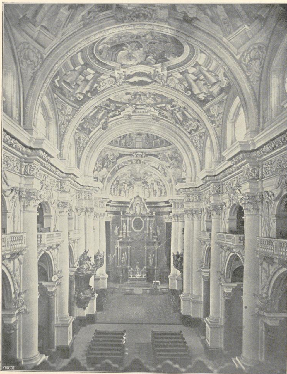
21. Inneres der Stiftskirche St. Florian bei Linz.

und bis 1675 von Gasp. Zucalli bis auf die Fassade vollendet. Der Bau bildet eine Kreuzanlage mit einer Kuppel über der Vierung. Die Stuckausstattung