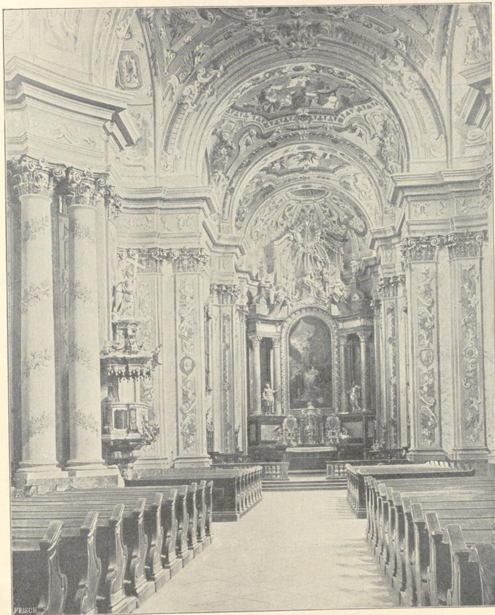
22. Inneres der Stiftskirche zu Herzogenbusch.

Die Barnabitenkirche zu Mariahilf (Erzherzgt. Österreich), 1660 begründet,