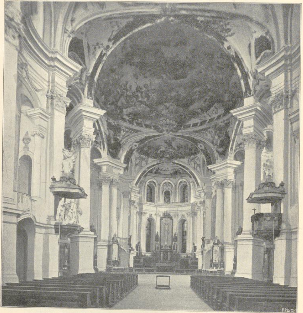
17. Inneres der Klosterkirche zu Neresheim.

ein Neubau nach dem Plane Frisonis, an Stelle des alten gotischen, zum Teil noch romanischen Gotteshauses ausgeführt. Es ist eine dreischiffige Hallen- anlage mit Emporen in den Seitenschiffen, Querhaus, hoher Tambourkuppel über der Vierung und halbrund geschlossenen Apsiden. Das Mittelschiff ist mit Zwickel- kuppeln überdeckt, die Seitenschiffe haben quergestellte Tonnen; sämtliche Gewölbe sind mit Gemälden versehen. Die Klosterkirche zu Wiblingen bei Ulm,