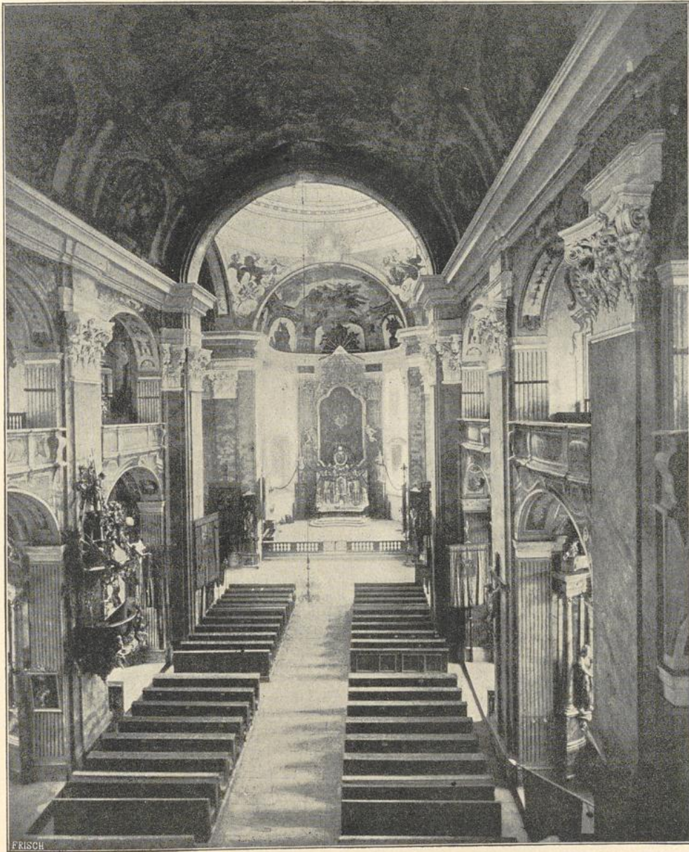
20. Inneres der Stiftskirche zu Pöllau.

die Nebenschiffe sind mit achteckigen Kloostergewölben überdeckt (Abbildg. 18). Die Kirche des Klosters Ottobeuren, nach einem Plane von Dominik Zimmermann von 1732, wird erst 1753 durch Joh. Mich. Fischer begonnen und 1766 geweiht. Der