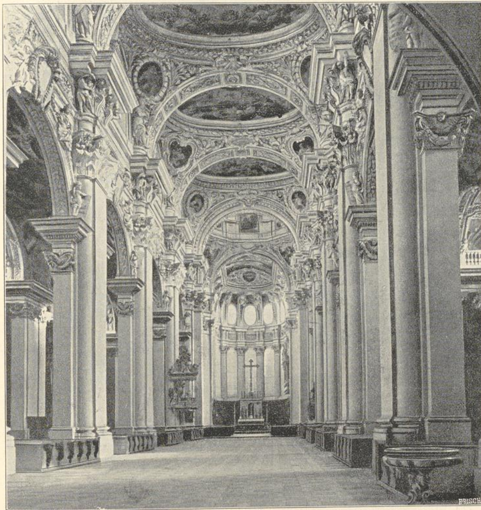
18. Inneres vom Dom St. Stephan zu Passau.

mittelalterliche Querschiffsanlage Verwendung. (Abbildg. 17). Die Kirche des Stiftes Haug zu Würzburg (Bayern), 1670—91 von Petrini, entspricht im Grundriss dem Gesù in Rom, obgleich Kapellen an den Querarmen vorkommen. Das Mittelschiff zeigt Tonnengewölbe auf korinthischen Pilastern und über der Vierung eine aus dem Achteck entwickelte Kuppel. Der Dom zu Kempten (Bayrisch Schwaben), 1652 begonnen, soll von Joh. Serro herrühren, und zeigt eine Ver-