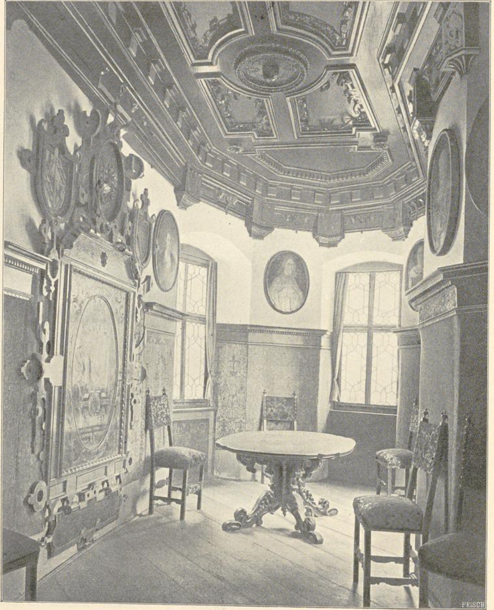
30. Zimmer im Schlosse Tratzberg.

und reich gefärbte Holzdecke bewahrt. Schloß Caprarola bei Viterbo, 1555—64 von Vignola erbaut, bildet im Grundriß eine fünfeckige Citadelle mit scheinbaren Bastionen, ist aber in Wirklichkeit ohne jede Verteidigungswerke. Die