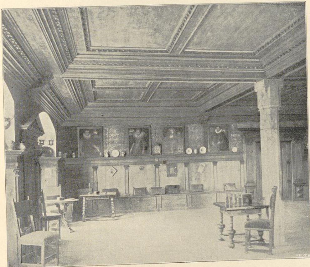
29. Zimmer im Schlosse Tratzberg.

Beispiele: Im Castel S. Angelo in Rom ist die Sala del Consiglio durch ein Spiegelgewölbe mit großer Kehle überdeckt; Decke und Wände sind mit reichen Malereien geschmückt (Abbildg. 31). Das Castello di Corte in Mantua, 1430—1506,