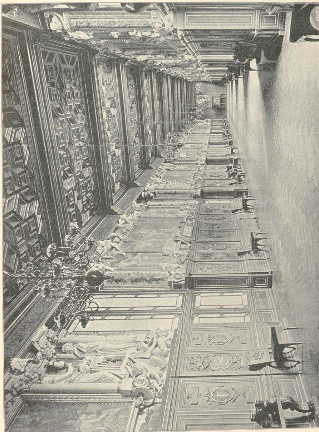
35. Galerie François I. im Schlosse zu Fontainebleau.

einschließen. Unter der Decke zieht sich ein feiner Rankenfries hin. Die Galerie Heinrich II., der ehemalige Festsaal, an der Cour ovale gelegen und an die Kapelle St. Saturnin anstossend, ist von Primaticcio dekoriert. Der rechteckige