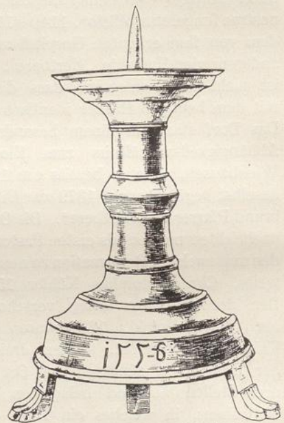
Fig. 7. Kirche in Harber; Altarleuchter.