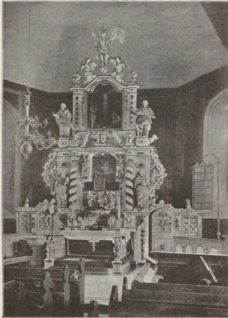
Fig. 8. Kirche in Ilten; Altar.

trägt. Die Helmdecke ist aussen roth und innen golden (gelb)“. 1738 wurde der zinnerne Becher gefertigt. Bei dem Einfall der Franzosen 1757 waren die Kostbarkeiten der Kirche vermauert.