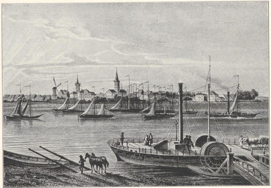
Stromleben bei Duisburg-Ruhrort um 1850