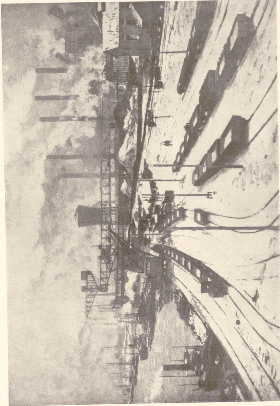
Eisenwerk am Rhein bei Duisburg