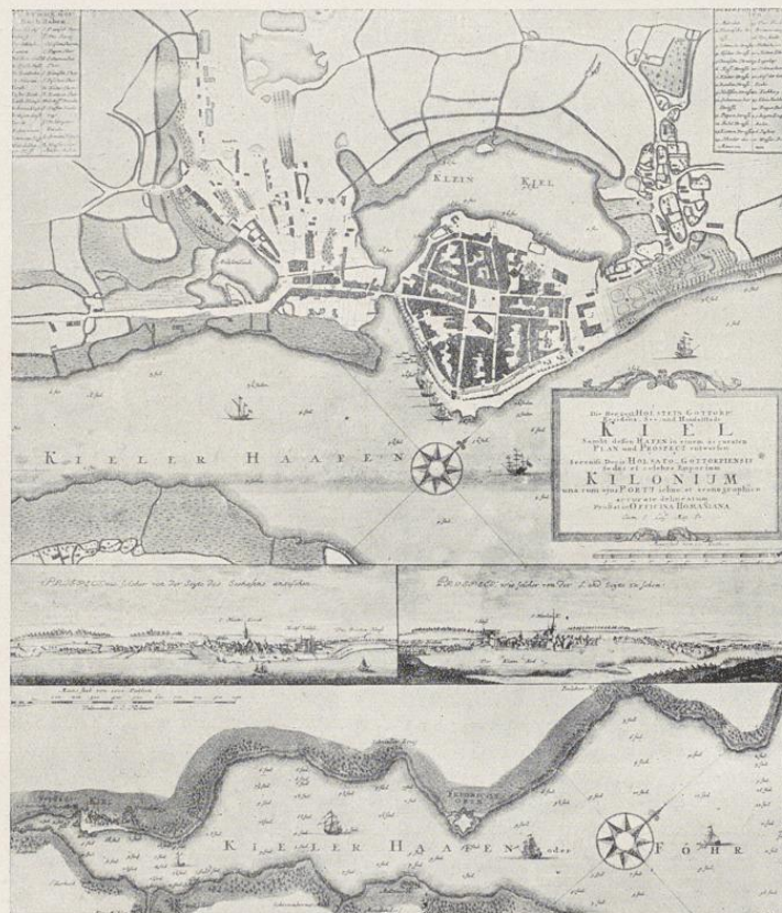
Plan der Stadt Kiel (Homannsche Karte um 1730)

1572 die Stadtdörfer dem Herzog auf 20 Jahre in Pacht überlassen. Diese Pacht wurde dann immer wieder verlängert, bis endlich im Jahre 1667 die Stadt diesen gewaltigen Grundbesitz durch den Permutationskontrakt dem Herzog Christian Albrecht förmlich abtrat. So wurde Kiel wieder eine kleine Stadt, nicht viel größer als sie im 13. Jahrhundert gewesen war. Einige von diesen Dörfern sind erst nachträglich wieder eingemeindet worden: Hassee, Wik, Gaarden, Wellingdorf. Die seit 1544 bestehende sogenannte gemeinschaftliche Regierung war besonders in der zweiten Hälfte des