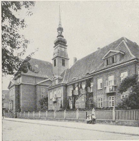
Lutherkirche