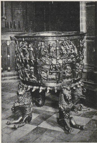
Altes Taufbecken in der Nikolaikirche