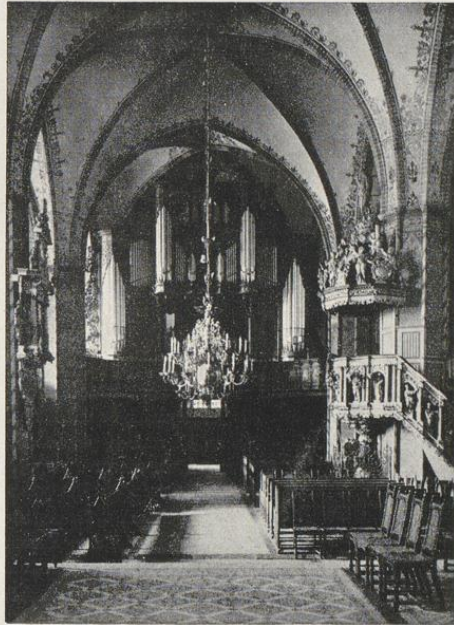
Inneres der Nikolaikirche