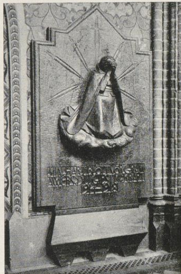
Kriegergedächtnismal in der Nikolaikirche von Ernst Barlach