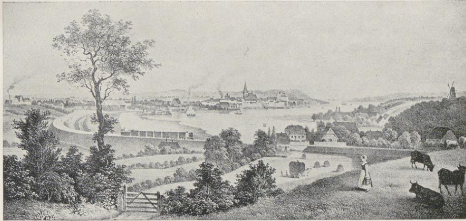
Ansicht der Stadt Kiel um 1850 (Blick von dem südlich der Stadt gelegenen Studentenberg)

sohn, mit 5 Regimentern in Kiel Quartier), können hier nicht vorgeführt werden, das Ende der Entwicklung war, daß der dänische König im Jahre 1720 die Abtretung des Gottorpischen Teils von Schleswig an Dänemark erzwang. Damit hörte Gottorp auf, die Residenz des Herzogs zu sein, und dieser Vorzug fiel nunmehr der Stadt Kiel zu.