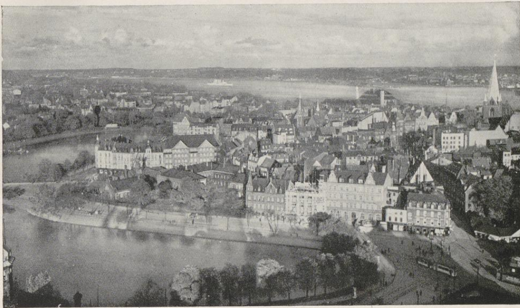
Blick vom Rathausturm auf die Altstadt