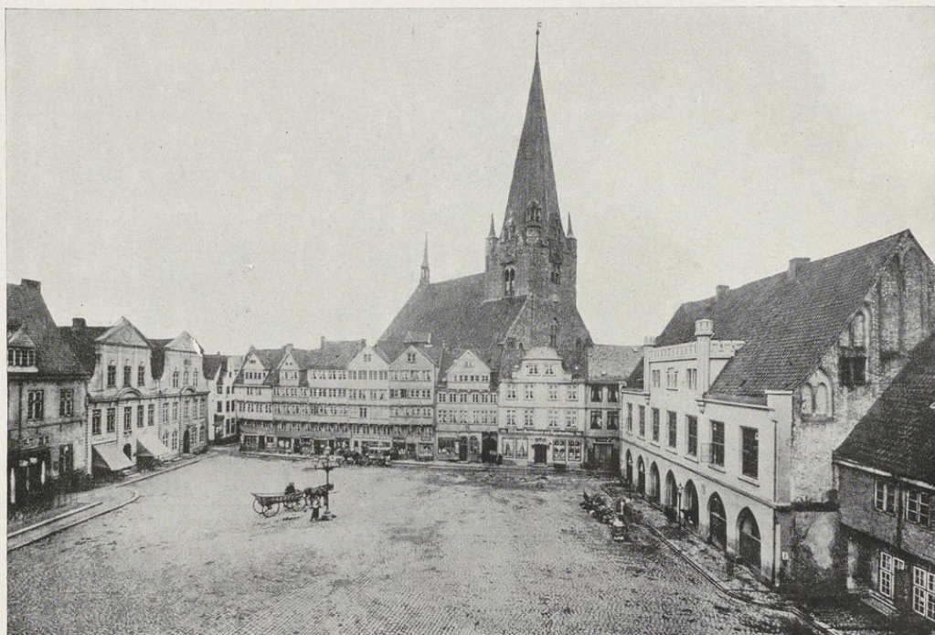
Altmarkt im früheren Zustande (etwa um 1860)