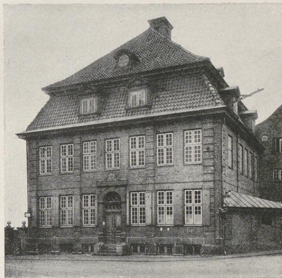
Das Schwefelhaus, erbaut von Sonnin. Stand im Zuge der heutigen Holstenstraße, bei deren Durchbau es bedauerlicherweise abgebrochen wurde.

alliance am 7. Juli 1815. Die Dänen schürten, zwar sehr gegen ihren Willen, diese Stimmung durch schikanöse Sprachenverordnungen und erreichten damit endlich doch das Gegenteil von dem, was sie eigentlich anstrebten, Holstein dänisch zu machen. Die Stimmung des ersten Menschenalters nach 1773 hatte sich gründlich geändert. Dazu begann seit etwa 1815 ein neuer Begriff die Gemüter zu erregen, ein Begriff, der mehreren Jahrzehnten den Stempel aufgedrückt hat, das Wort „Verfassung“. Für sie kämpften die 1815 begründeten Kieler Blätter von Falck, Dahlmann u. a., deren Erscheinen eine politische Tat war. Noch mehr wurde seit dem Auftreten Lornsens die Verfassungsfrage das politische Hauptthema in Holstein, und nirgends wurde dieses Thema leidenschaftlicher behandelt als in Kiel. In den politisch bewegtesten Zeiten der neueren Geschichte Schleswig-Holsteins, von den 30er bis in die 60er Jahre des verflorenen Jahrhunderts, war Kiel der eigentliche Mittelpunkt allen politischen Lebens, und die besten Köpfe der Universität Kiel waren