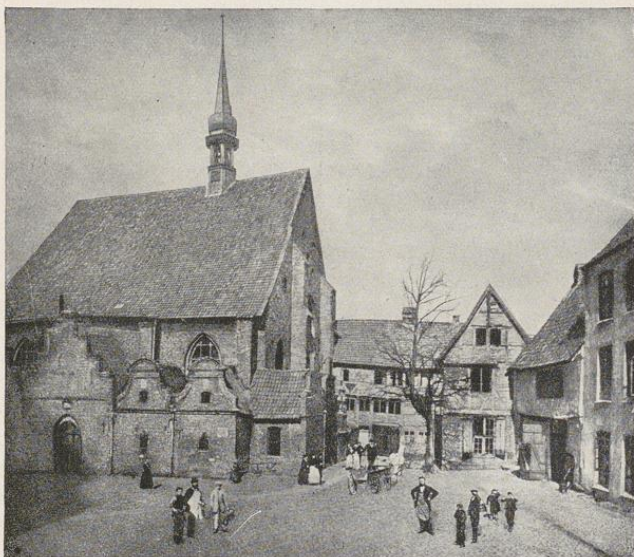
Klosterkirchhof im alten Zustande Dieser trauliche Winkel Alt-Kiels fiel dem Durchbruch der Falckstraße zum Opfer

Mehrere Perioden in der Entwicklung dieser Stadt lassen sich deutlich unterscheiden. Eine Blütezeit, die bald nach der Gründung einsetzt und auch im 14. Jahrhundert anhält, Kiel eine aufstrebende See- und Hansestadt. Dann das Kiel des 15. bis 18. Jahrhunderts, eine Landstadt mit geringer Bedeutung, trotz des Hafens. Die dritte Periode seit 1773, die wieder viel Ähnlichkeit mit der ersten hat. Aber immer noch eine Stadt von mäßiger Größe, ohne weittragende Bedeutung. Diese Stadt endigte bald nach der Annexion durch Preußen. Das Kiel in seiner vierten Periode, die Marinestadt, die unheimlich schnell zu einer großen Stadt geworden ist, ähnelt dem alten Kiel fast nicht mehr. Diese vierte Periode ist 1918 zu Ende gegangen, und wir stehen nun mit vollem Bewußtsein am Beginne des fünften Kapitels der Stadtgeschichte.