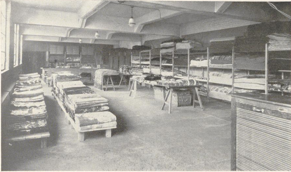
Lager und Versandraum der Decken-Abteilung

lung bildete den Anfang zur späteren ausgesprochenen Plüschweberei.