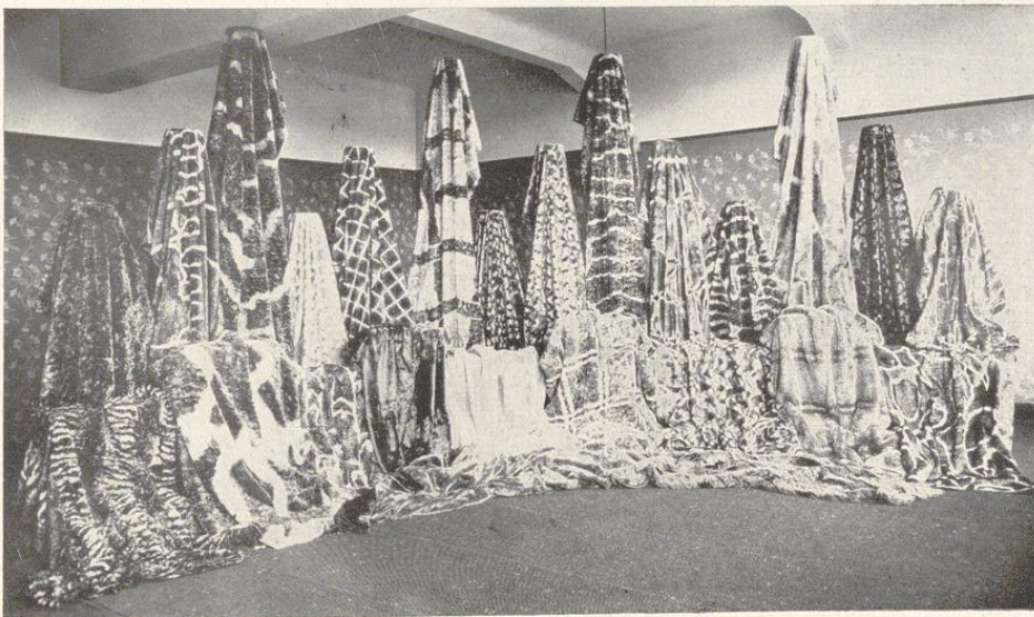
Ausstellungsraum für Decken

Sämtliche Erzeugnisse werden durch eine bewährte Verkaufs-Organisation außer in Deutschland auch direkt und indirekt im europäischen Auslande sowie nach Uebersee vertrieben.