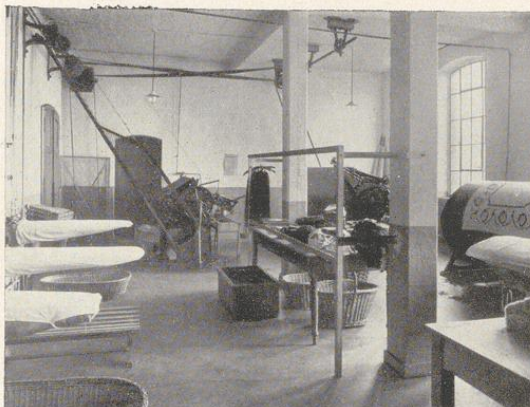
Teilansicht der Appretur

Duisburg, Sonnenwall 43, Fernruf 1974 Duisburg, Mülheimer Straße 56 Duisburg, Ruhrorter Str. 84a, Fernruf 574 Ruhrort, Ludwigstraße 9 Beeck, Am Markt 4 Meiderich, Auf dem Damm 79 Marxloh, Kaiser-Wilhelm-Straße 254 Homberg, Mörserstraße 51 Mörs, Homberger Straße 38 ferner in Ratingen, Wesel, Emme- rich usw.