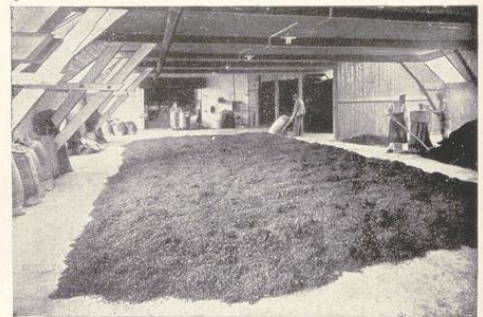
Kühl- und Mischraum.

Zur Zeit der Gründung der Firma Böninger in Duisburg bestand bereits eine lebhafte Einfuhr fremden Tabaks nach Deutschland, welcher zum größten Teil von