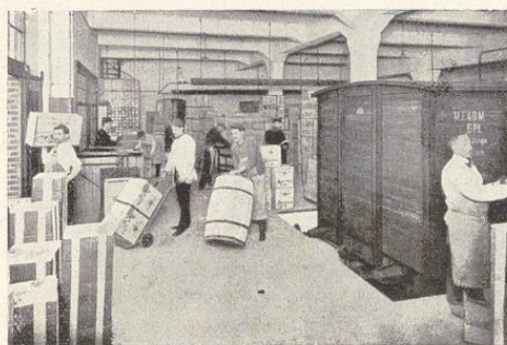
Pack- und Verladerraum.

Infolge des unglücklichen Ausgangs des bald nach der Vollendung der neuen Anlage ausgebrochenen Weltkrieges und infolge der Maßnahmen der Besatzungsbehörde, welche im Jahre 1919 eine Zollgrenze an dem linken Rheinufer errichtete und die Duisburger Fabrik dadurch von einem wesentlichen Teil der Kundschaft abschürfte, wurde die Errichtung einer neuen Fabrik in Andernach a. Rh. notwendig, die im Jahre 1920 in Betrieb kam.