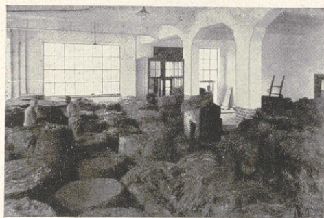
Lager der verzollten Rohtabake.

Holland den Rhein herauf kam. So war die günstige Lage der Stadt für den Duisburger Tabakhandel von besonderem Vorteil. Als Tabakgenüßmittel kannte man in dieser früheren Zeit allein Schnupf- und Rauchtobak. Der Schnupftobak war bereits bei den Indianern Amerikas bekannt, als die ersten Kenntnisse des Tabaks nach Europa gelangten. Unter Franz II. kam der Schnupftobak nach Frankreich, und unter Ludwig XIV. war die Tabakdose unyermeidliches Attribut jedes Herrn und auch jeder Dame der besseren Gesellschaft.