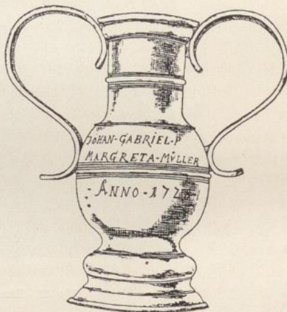
Fig. 38. Kirche in Meinerdingen; Zinnvase.

Vasen. In die beiden Zinnvasen sind die Namen der Stifter und die Jahreszahlen 1702 und 1728 eingraviert (Fig. 38).