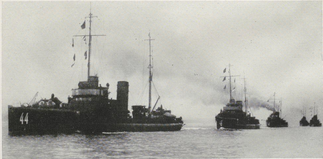
Torpedoboote in Kiellinie

Doch das Bild Kiels als Marinestadt würde unvollständig sein, wenn nicht auch an dieser Stelle kurz auf die drei großen Werften hingewiesen würde, die Germaniawerft, die Deutschen Werke, ehemals Kaiserliche Werft, und die Howaldswerft, die sämtlich am Ostufer der Förde gelegen, früher mit ihren rund 20 000 Arbeitern fast ausschließlich auf Kriegsschiffsbau eingestellt waren und durch zahlreiche Kanäle einen großen Teil des Geldes, das vor dem Kriege auf den Ausbau der deutschen Kriegsflotte verwandt werden konnte, der Stadt Kiel und seinen Wirtschaftskreisen zuführten. Diese Werften haben besonders schwer unter den Folgen des Niederganges unserer Seemacht zu leiden gehabt, aber es ist zu hoffen, daß der fortschreitende Wiederaufbau und die allmähliche Erneuerung des Schiffsmaterials der Reichsmarine auch ihnen zum Vorteil gereichen und damit der schwergeprüften Marinestadt Kiel eine weitere Belebung ihres Handels und Wandels bringen wird.