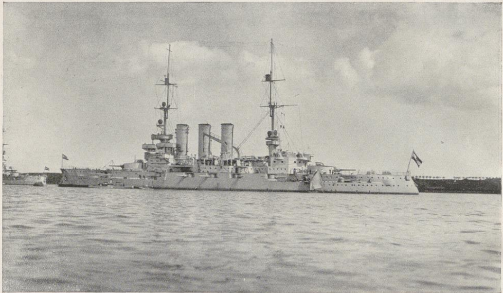
Kriegsschiffe auf dem Hafen

Neben dem angeführten ideellen Grund haben andere Faktoren dazu beigetragen, diese rückläufige Bewegung herbeizuführen. In erster Linie hat hierbei das Vorhandensein wertvoller ortsfester Anlagen der Marine in Kiel mitgesprochen. Der Organisator der alten Marine, Großadmiral v. Tirpitz, hatte, soweit der wegen der strategischen Verhältnisse vor dem Kriege wichtigere Ausbau Wilhelmshavens Mittel übrig ließ, auch die Ausgestaltung Kiels zu einem modernen Ansprüchen genügenden Flottenstützpunkt nach Kräften gefördert. Die alten im Innern des Hafens und der Stadt geschaffenen Anlagen, die sich den gesteigerten Anforderungen nicht mehr gewachsen zeigten, konnten aber nicht wesentlich erweitert werden, da die Stadt, deren beinahe beispielloses Wachstum in den 30 Jahren der Regierung Kaiser Wilhelms II. mit der entsprechenden Entwicklung der Marine in dieser Zeit gleichen Schritt hielt und in der Hauptsache auf sie zurückzuführen ist, diesen Platz inzwischen mit ihren Bauten belegt hatte. So entstanden die in ihrer Art einzig dastehenden großen Anlagen an der Wiker Bucht und in Holtenau, die das Entstehen eines ganzen Stadtteiles Wik anstelle des früheren Dorfes gleichen Namens zur Folge hatten. Wik und Holtenau sind jetzt Teile der Gesamtstadt Kiel. Die in dem letzten Jahrzehnt vor dem Kriege erbaute Kasernenanlage in der Wik besteht aus 16 Kasernen,