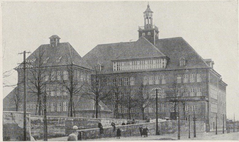
Schule am Winterbecker Weg — Städt. Hochbauamt