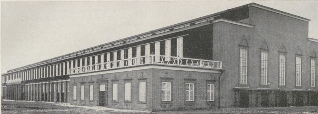
Städt. Ausstellungshalle an der Gutenbergstr. — Arch. Prinz