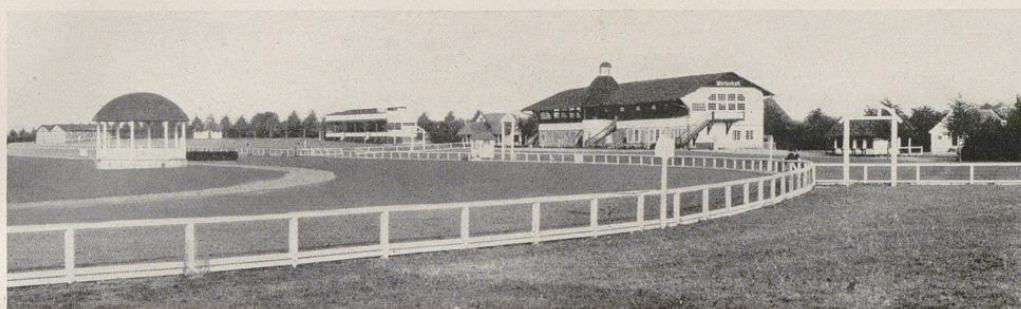
Großer Sport- und Spielplatz

einer Seestadt am längsten beherrschten. Bildeten sie doch nicht nur den Ausgangspunkt der gesamten Entwicklungsgeschichte der Stadt, sondern auch die Grundlage eines ihrer hauptsächlichsten Existenzmittel. Waren auch die üblichen Spiele jener weit zurückliegenden Zeit in Kiel bekannt, vor allem auch das heute noch hier und da geübte Bosseln, das leider anscheinend immer mehr der Vergangenheit anfallen will, so kam doch erst richtiges Leben auf die grünen Anger der Stadt, als Jahn mit seinem deutschen Turnen den Leibesübungen neue Wege erschloß. So ist mit der neuen Geschichte der Stadt und nicht nur mit ihr, sondern auch mit der Provinz, das Kieler Turnwesen eng verbunden. Schon in den Kämpfen um die Befreiung Schleswig-Holsteins von dänischer Herrschaft haben sich die Kieler Turner bei Bau hervorgetan. Und noch heute trägt der älteste Kieler Turnverein, der Männer-Turnverein von 1844, mit Stolz die zerschlossene Fahne von Bau. Verein auf Verein schoß zu einer machtvollen Gemeinsamkeit empor. Kieler Turner siegten stets auf den Kreis- und deutschen Turnfesten und trugen zuerst den Namen Kiels in das neue Deutschland.