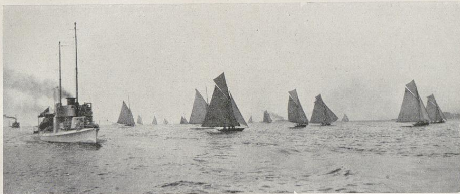
Kieler Woche 1912