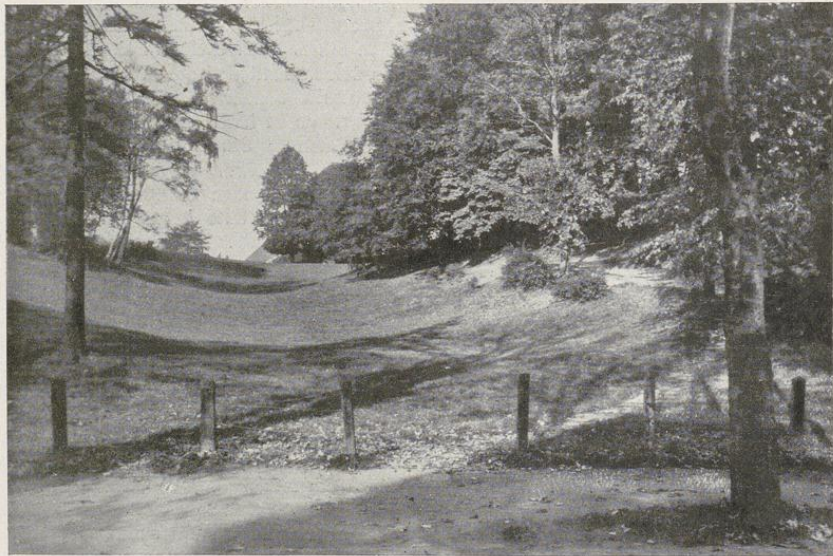
Krusenkoppel am Düsternbrooker Gehölz

Der kurze Raum gestattet nur die Aufzählung der wichtigsten Wanderziele, die von Kiel gut erreichbar sind. Auf Einzelheiten konnte nicht eingegangen werden. Das Gesagte dürfte aber genügen, um zu zeigen, daß es sich wohl lohnt, von Kiel aus den Norden kennen zu lernen.