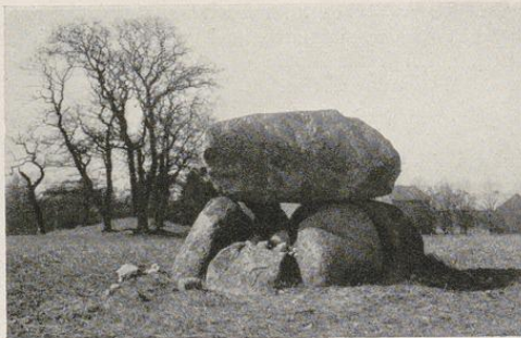
Hünengrab im dänischen Wohld