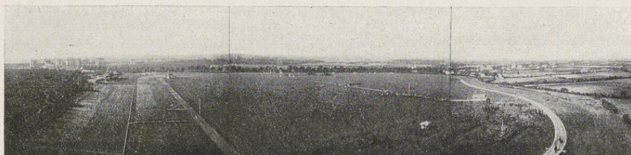
Großer Sport- und Spielplatz im Nordwesten

So bietet die Stadt am Meer ein weitumfassendes Bild sportlicher und turnerischer Regsamkeit, die unterstützt und gefördert von dem Wohlwollen der Behörden und getragen von der Gunst und dem Verständnis der Bevölkerung sich immer weiter entfalten wird.