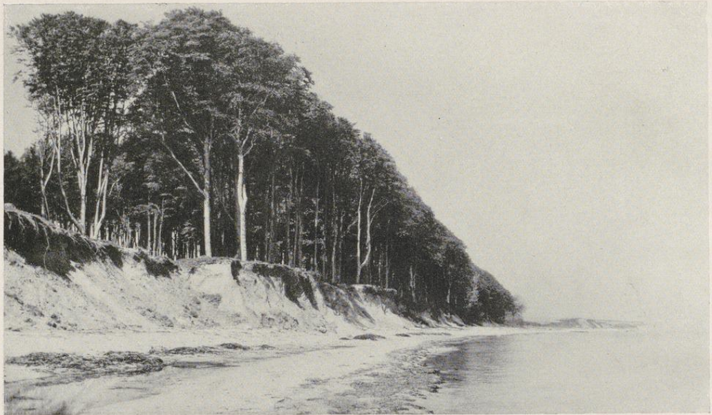
Steilufer bei Bülk an der Eckernförder Bucht

Die größte Sehenswürdigkeit der Stadt Preetz ist die sehr alte, gut erhaltene Klosterkirche, die unter anderem einen berühmten, von Hans Gudewert geschnitzten Altar birgt. Durch die ausgedehnten Klosterwäldungen, das Rönner Gehege, kann man bis zur letzten Bahnstation vor Kiel zurückwandern, muß aber dann natürlich einen ganzen Tag für die Fahrt ansetzen.