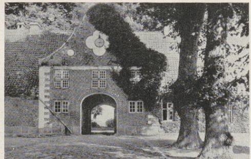
Gut Rasdorf