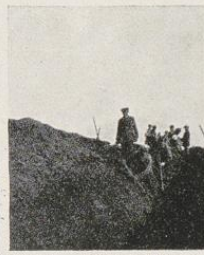
Städt. Erwerbslose b. Anlegen v. Entwässerungsgräben im Moor