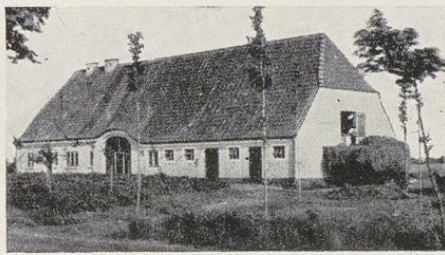
Neue ländliche Siedlerstelle auf dem Gelände des ehemaligen Remontedepots Hardebek