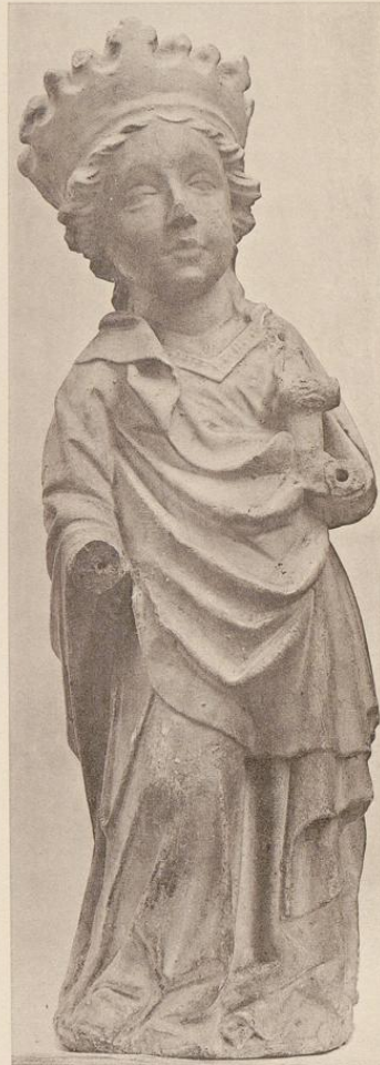
1. Eichdruck von Kömmler & Jonas, Dresden.