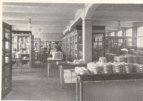
Lager und Verkaufsraum

Den Versuch, einen Industriezweig, dessen Heimatstätte fast ausschließlich Bielefeld und Berlin ist, zu verpflanzen, ist hier in hervorragender Weise gelöst worden. / Große, helle u. hygienisch einwandfreie Arbeitsräume, in welchen von zirka 200 Arbeitern und Arbeiterinnen Oberhemden und Kragen angefertigt werden, gewährleisten ei-