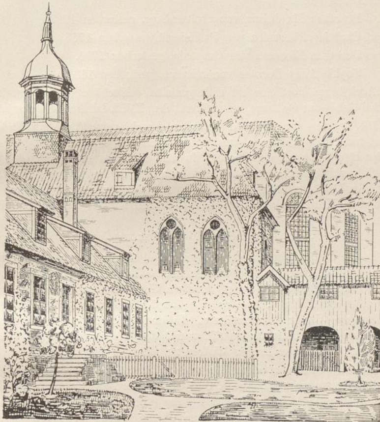
Fig. 65. Kloster in Walsrode.

In einer Nische der Südwand über dem Sitze der Aebtissin steht auf einem mit Vierpässen geschmückten Sockel das mit Ausnahme der Füße aus einem Stück Eichenholz geschnitzte Bild des Klosterstifters in blauem Gewande und rothem Mantel. Die Rechte hält ein Schwert mit herumgewundenem Tragriemen, die Linke ein Kirchenmodell. Das Ganze zeigt die ausgeprägten Formen der ersten Hälfte des XIV. Jahrhunderts.