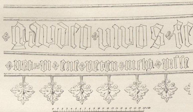
Fig. 64. Kirche in Walsrode; Glockeninschrift.

Auf der oberen Westprieche der Stadtkirche steht eine nicht mehr benutzte Altarwand in ausgeprägten Regenceformen aus dem Jahre 1745 (siehe Geschichte).