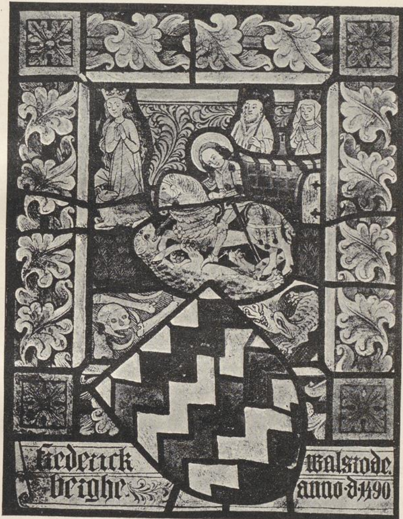
Fig. 66. Kloster in Walsrode; Glasmalerei.