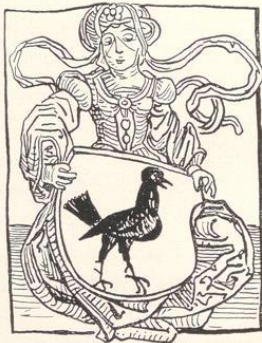
Aus einer Inkmabel-Sammlung der Schloßbibliothek zu Berleburg. (Siehe Seite 18.)

Beiträge zur Geschichte der Kirche und Pfarrei Birkelbach von Friedrich Göbel. Wittg. Kreisblatt 1868, Nr. 31, 32, 33.