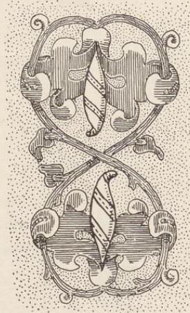
1 Aus einem Pergament-Manuscript der Bibliothek zu Haus Offer (siehe unten).