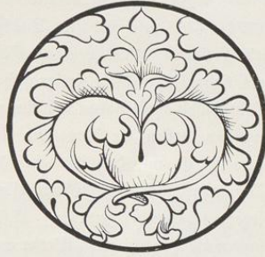
Von der Kreuztafel der Kirche Maria zur Höhe in Soest. (Siehe unten.)