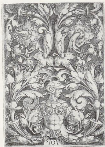
Nach Kupferstich von Aldegrever (B. 252). (1 : 1.)